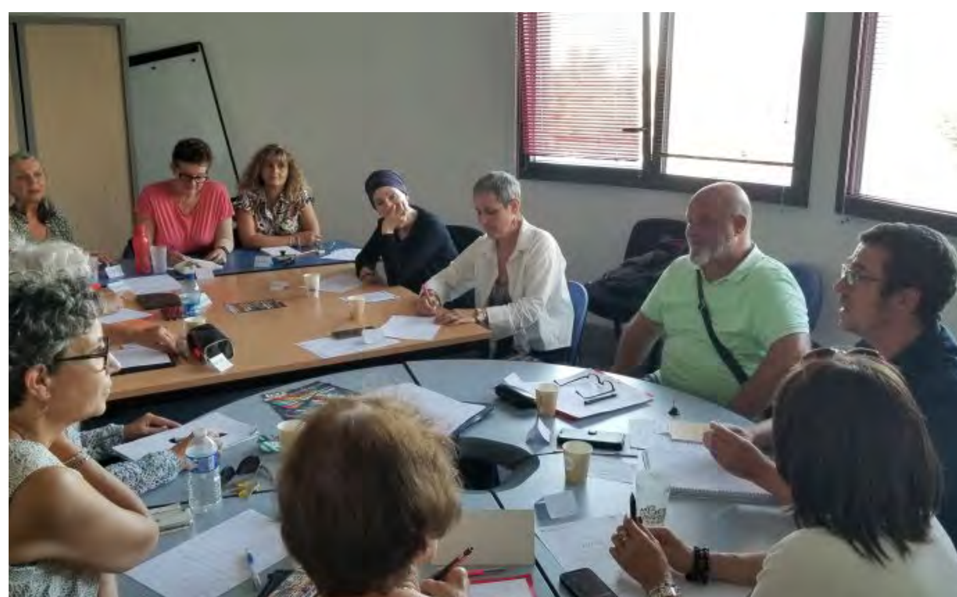
L'atelier d'écriture, un espace d'évasion pour les patients