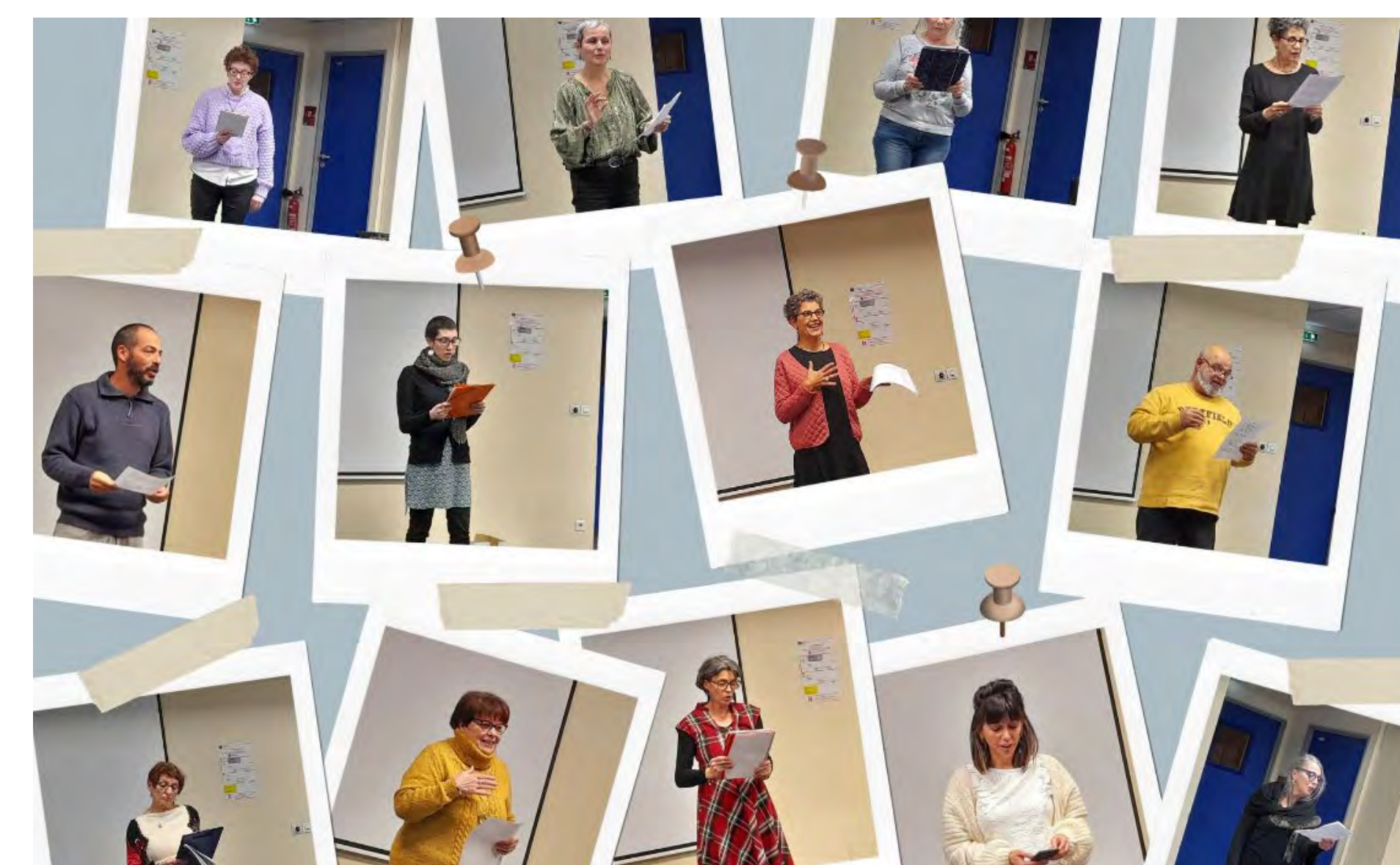
Restitution des ateliers d'écriture : partage, lecture et émotion au rendez-vous !