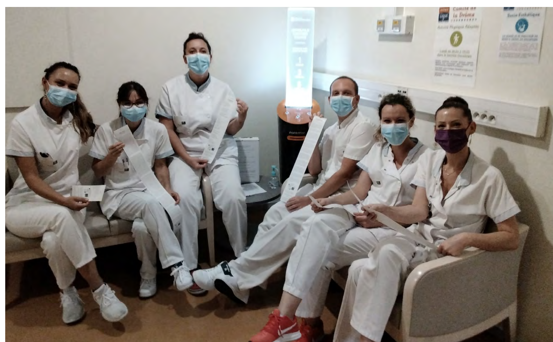
Inauguration du Distributeur d'Histoires Courtes, plébiscité par les soignants