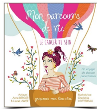
MON PARCOURS DE VIE Le cancer du sein / Préserver mon bien-être