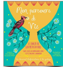
MON PARCOURS DE VIE Le cancer du sein métastatique