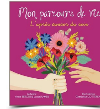
MON PARCOURS DE VIE L'après cancer du sein