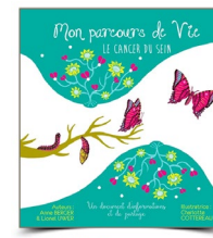
MON PARCOURS DE VIE Le cancer du sein