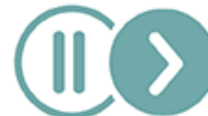
FONDATION FRANCE RÉPIT